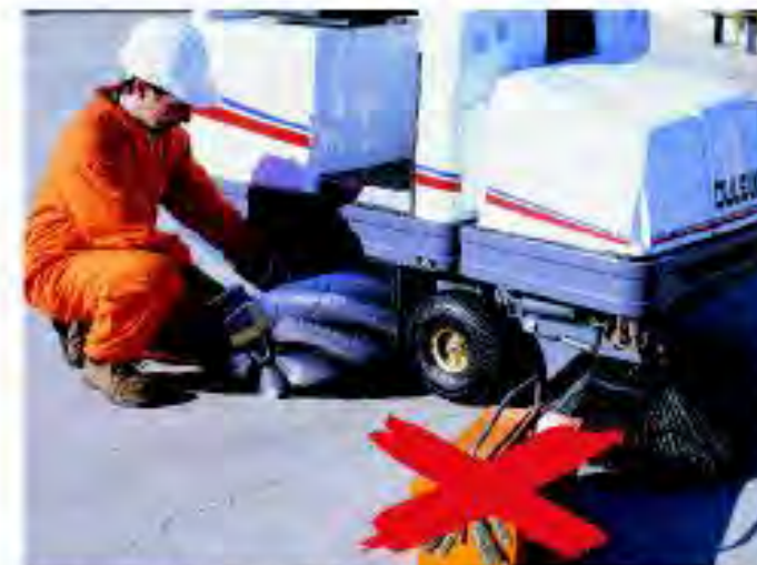
Smontaggio della spazzola centrale senza l'utilizzo di attrezzi