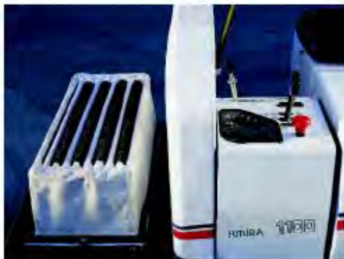
Sistema filtrante brevettato