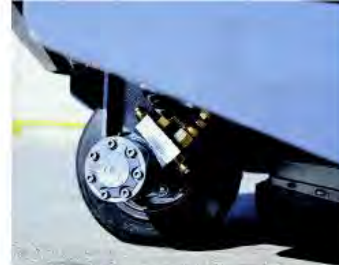
Trasmissione diretta con motoruota

La Dulevo 1100 FUTURA è estremamente maneggevole; può invertire la direzione di marcia con una sterzata di circa 1,1 metri di raggio (secondo le norme CUNA).