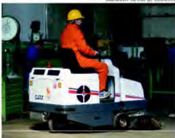
Massimi livelli di comfort