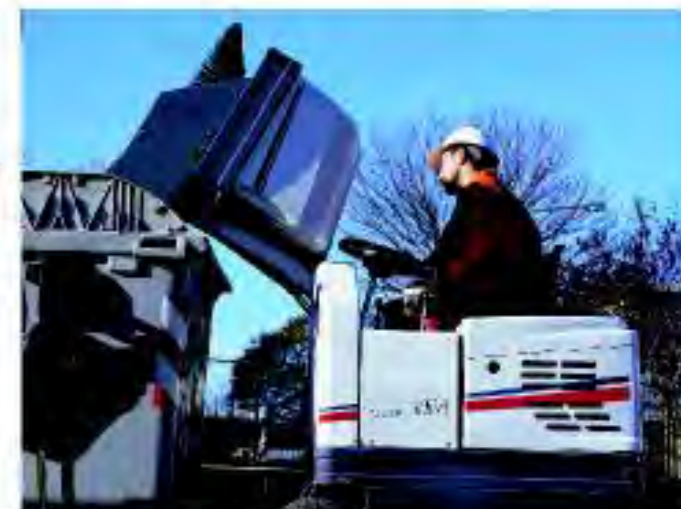
Scarico in quota