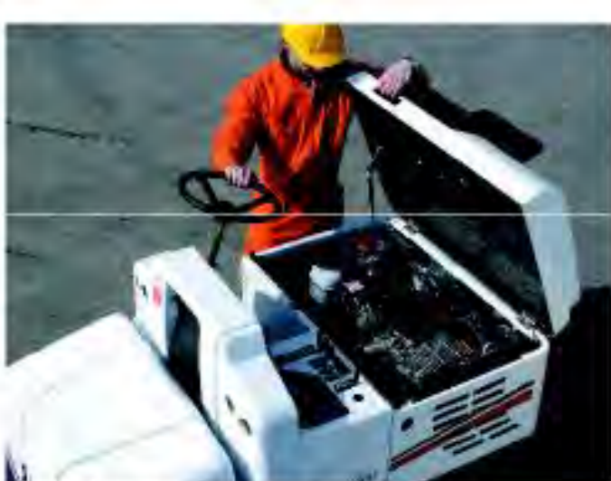
Facilità d'accesso al vano motore